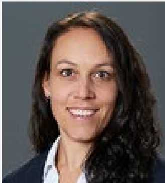
Fachverantwortliche Tarife H+